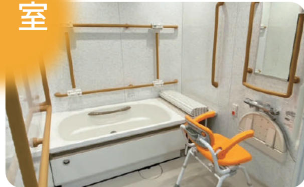
※家具・レイアウトはイメージです。